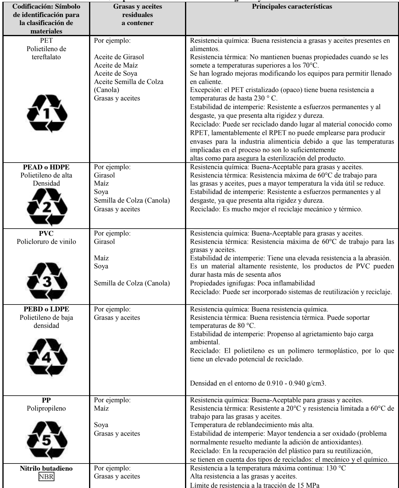
Tabla 1. Compatibilidad de materiales con las grasas y aceites residuales.