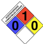
Bajo la NOM-018-STPS-2000